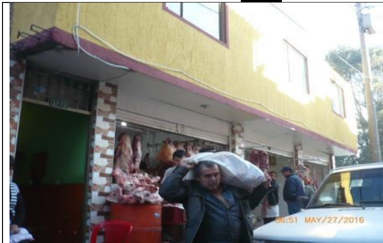
16. Carrera 62 D No. 57D- 27 Sur Local - AAA0052YDTO